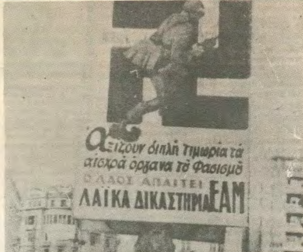
Πλακάτ των ημερών της απολευθέρωσης. Ο λαός ζητά Λαϊκά Δικαστήρια. Την ίδια στιγμή το Κ.Κ.Ε. υποτάσσεται στον Γ. Παπανδρέου και στον Τσώρτσιλ. Οι δοσίλογοι και οι ταγμασφαλίτες επιβιβάζονται και περνούν στην επίθεση.

Όταν «η κυβέρνηση του Βουνο» ανακάλεσε την αντιπροσωπεία του ΕΑΜ στον Λιβάνο επειδή «παροβίασε» τις οδηγίες της Κ.Ε., ο σοβιετικός διπλωμάτης Τσερνόσεφ διαμαρτυρήθηκε στο μέλος του Π.Γ. του ΚΚΕ Ιωαννίδη για την ανάκληση. Όταν του ανακοινώθηκε ότι έγινε παραβίαση των οδηγιών απάντησε ειρωνικά: «Και λοιπόν; Τώρα τι θα κάνετε; Θα κηρύξετε πόλεμο της Αγγλίας; Αυτή ήταν η πολιτική του Στάλιν.